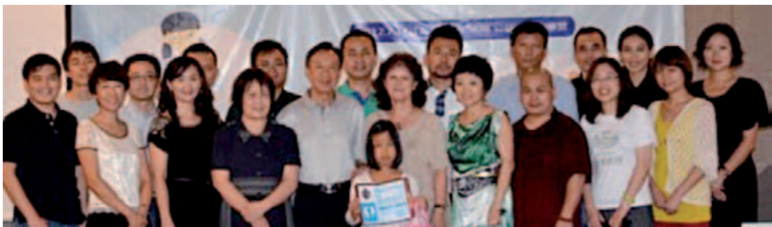
Lancering van het programma in juli werd bijgewoond door Shenzhen officials en Chinese beroemdheden.

De cursus bestaat uit tien lessen met als onderwerpen: respect voor het leven, dierenwelzijn, verantwoord huisdierenbezit, veilige omgang met dieren, inlevingsvermogen en compassie.