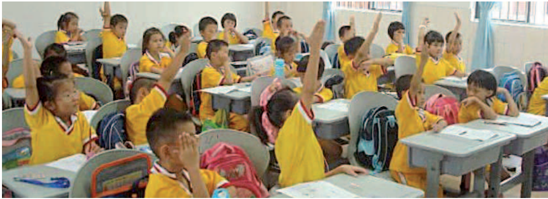
Eerste les dierenwelzijn op een basisschool in Shenzhen